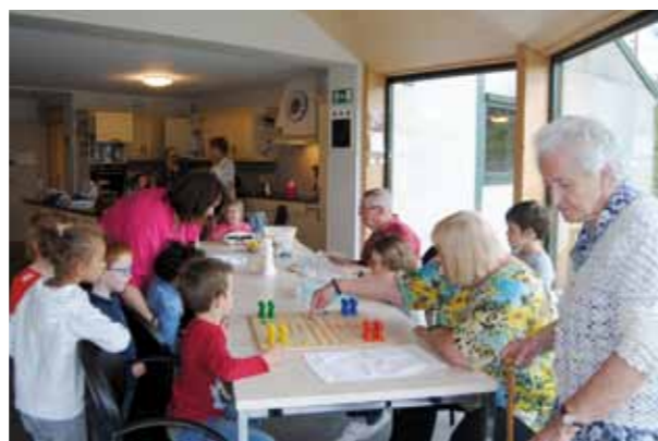
Carrefour des générations