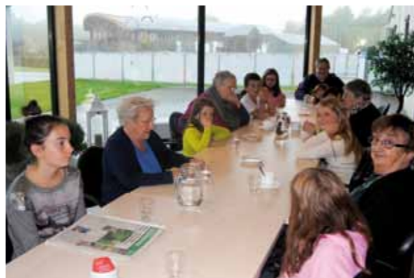
Place aux enfants 2015