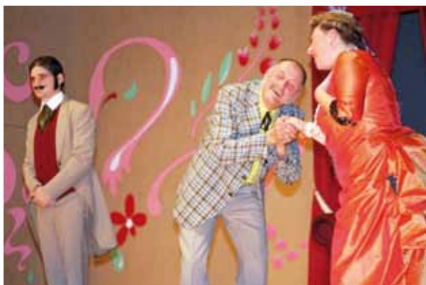
Pièce de théâtre «Les Charlots» à Freux