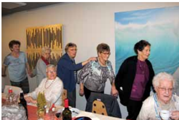
Fête du Nouvel An 2016