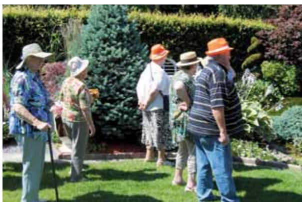
Visite des jardins à Verlainne