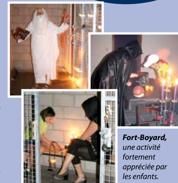
Fort-Boyard, une activité fortement appréciée par les enfants.