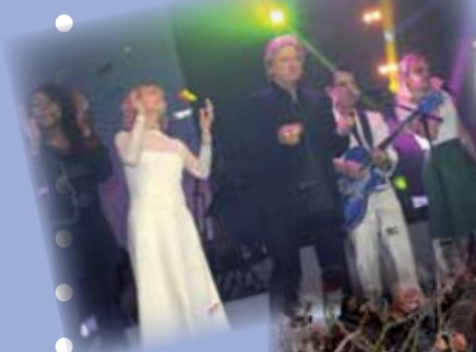
En route vers « Âge Tendre et Tête de Bois »

Les séries complètes des photos sont visibles sur le site internet du C.P.A.S. de Libramont-Chevigny, à l'adresse : http://cpas.libramontchevigny.be