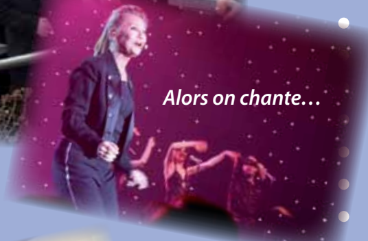
Alors on chante...