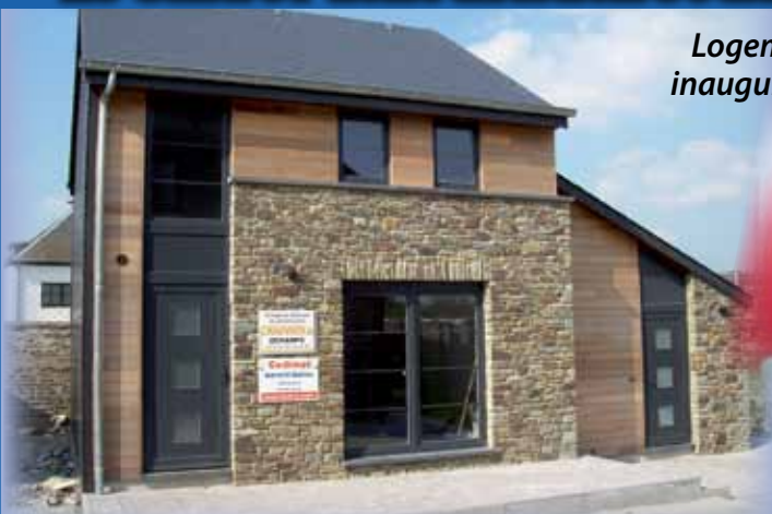
Logement d'urgence, inauguré le 19 juin 2009