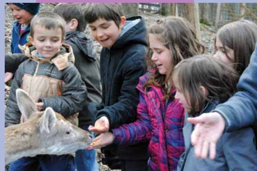
Une après-midi nature au parc à gibiers de Saint-Hubert