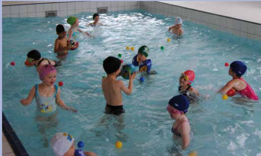
Une matinée à la piscine de Saint-Hubert

Ce service existe déjà depuis 2004 et fonctionne très bien. C'est à partir du mois d'avril 2012 à l'occasion des vacances de Pâques, que l'Accueil Temps Libre a été transféré dans les tous nouveaux locaux de Libr'Accueil, à la rue du Printemps à Presseux. (600 m 2 )