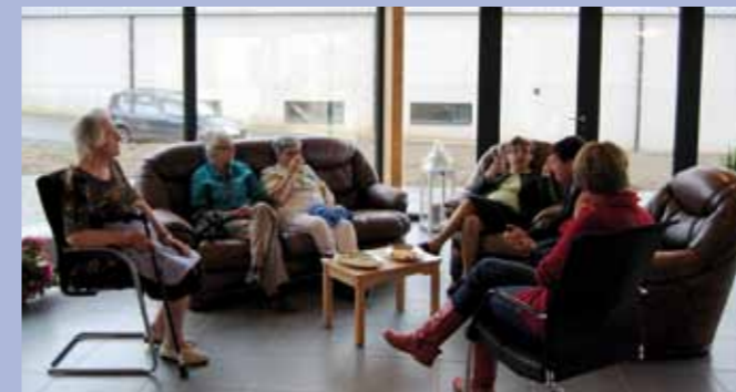
Une salle de rencontre et de détente

La Maison Communautaire pour personnes âgées est maintenant ouverte !