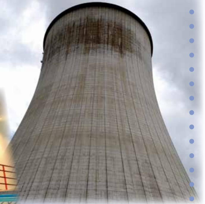
Tour de refroidissement de Tihange 2.

... ainsi que les normes de sécurité pour y entrer.