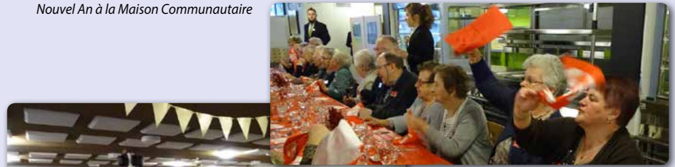
Nouvel An à la Maison Communautaire