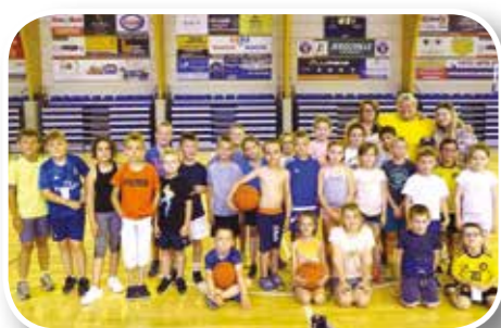
PLACE AUX SPORTS - Du 1 er au 5 juillet 2019